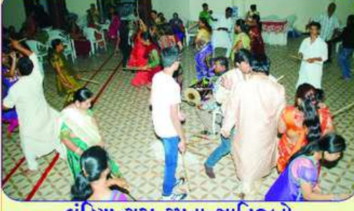
ઘાંડિયા રાસ સ્મતા જ્ઞાતિજનો