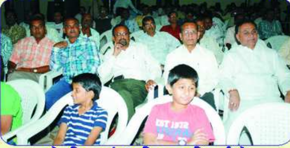
સ્નેહમિલનમાં ઉપસ્થિત જ્ઞાતિભાઈઓ