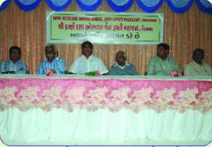
મહાજનશ્રીના મંચરચ પદાધિકારીઓ