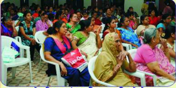
સ્નેહમિલનમાં ઉપસ્થિત જ્ઞાતિબહેનો