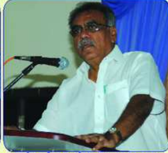
સેક્ટરી શ્રી મોનીક ધરમશી દ્વારા પ્રવૃત્તિ આરંભવાર