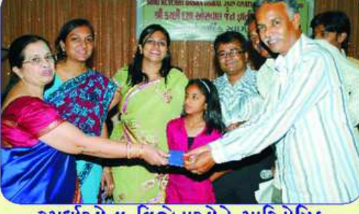
સ્પર્ધાઓના વિજેતાઓને પારિતોષિક